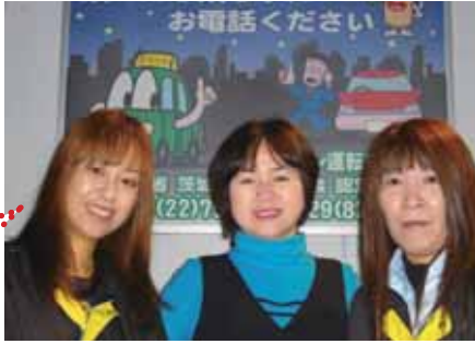
女性のお客さまも安心してご利用いただけます

最近では女性のお客さまも増えてきて、女性のお客さまに「女の人て安心する」といってお言葉を頂いたりもします。